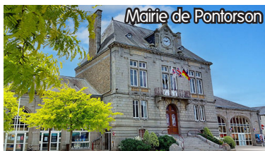
Mairie de Pontorson