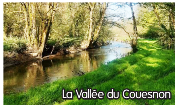
La Vallée du Couesnon

QUEST BIOLOGIE ..... 02 99 80 70 11 VAL COUESNON (ANTRAIN) LABORATOIRE RIGOLE ..... 02 99 98 41 45