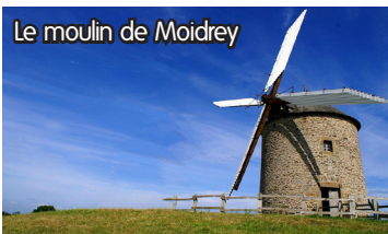
Le moulin de Moidrey

2 rue du Plan d'Eau ..... 02 99 48 62 78 mairie-vieux-viel@orange.fr Lundi, mardi, jeudi, vendredi : 9h-12h30