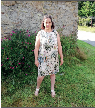
Immo Morgane Tél : 06 35 90 10 08