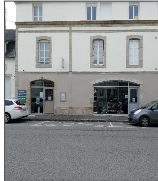
Ambulances Le Meur-Le Gal Tél : 02 97 23 09 29