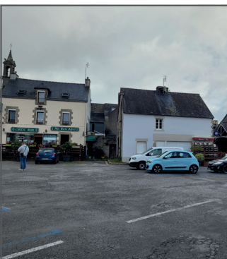
Le Bon Abri Tél : 06 52 75 23 80