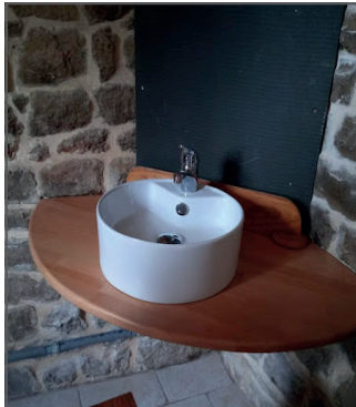
Plomberie Giry Tél : 06 52 36 49 77