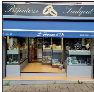
L'Anneau d'Or Tél : 02 97 33 32 08