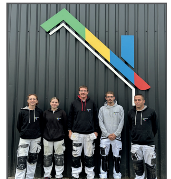
Décoréno 56 Tél : 06 65 01 49 55