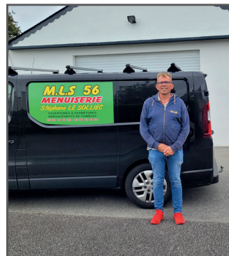
M.L.S 56 Tél : 02 97 23 04 34