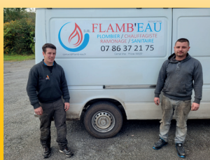
EURL Flambeau Tél : 07 86 37 21 75