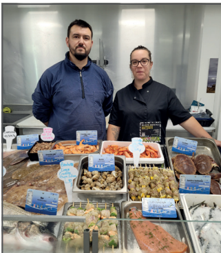
Halle aux Pesked Tél : 06 44 18 93 25