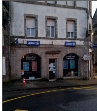
Allianz Tél : 02 97 23 22 23