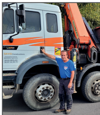
David Construction Tél : 02 97 34 26 79