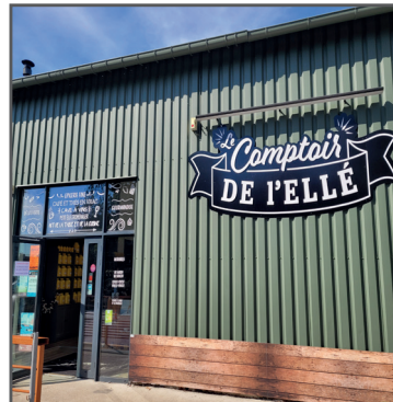
Le comptoir de l'Elle Tél : 02 97 34 57 48