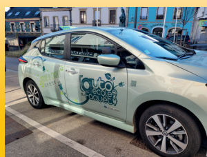
Auto-Ecole du Faouët Tél : 02 97 23 73 41