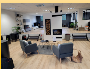
Ellé Flamme Tél : 02 97 23 86 24