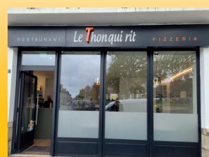
Le Thon qui rit Tél : 02 97 23 21 67