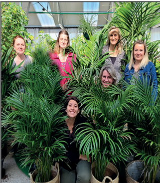
Jardinerie Simorin Tél : 02 97 23 16 69