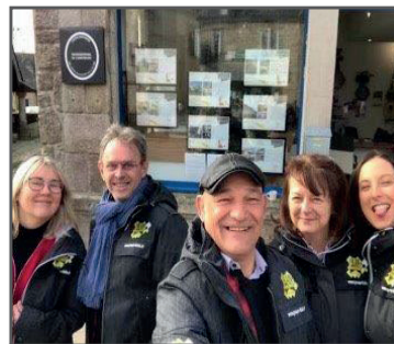
Blain Habitat Tél : 02 97 34 27 91