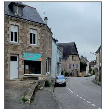
Breizh Bobines Tél : 02 97 34 78 22